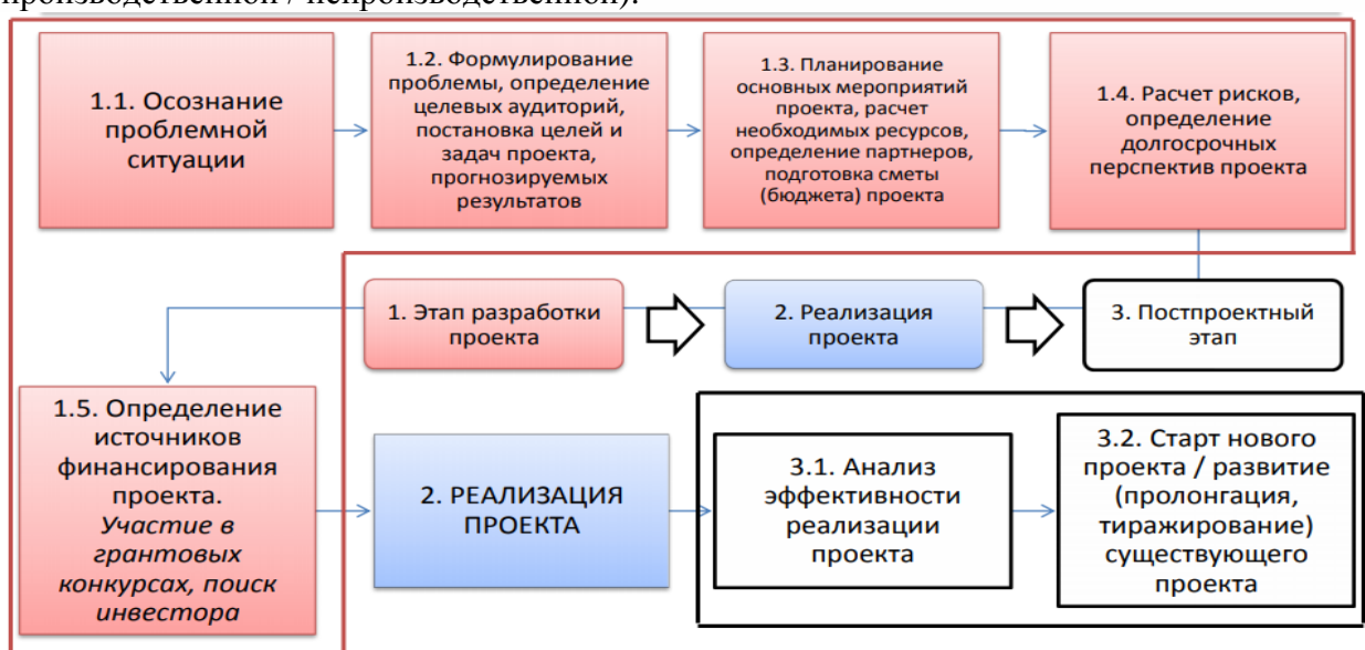
Рис. 2. Схема-алгоритм создания бизнес-модели в инновационной экономике. Типовая бизнес-модель бизнес-модели в инновационной экономике.

Задание. Изучите материал представленных на сайте [ https://www.openbusiness.ru ] описаний готовых руководств для разработки бизнес-планов и составьте алгоритм создания бизнес-модели в инновационной экономике производственной / непроизводственной сферы по схеме на рис. 2 и бизнес-модель бизнес-модели в инновационной экономике по схеме на рис. 3 (на выбор для одной из сфер – производственной / непроизводственной):